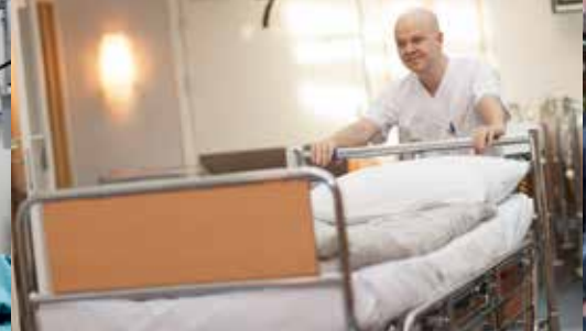
Befolkningsvekst gir behov for flere senger.