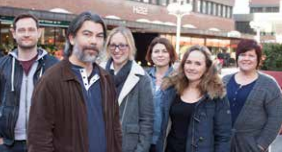
Psykisk helsevern i byens hjerte.