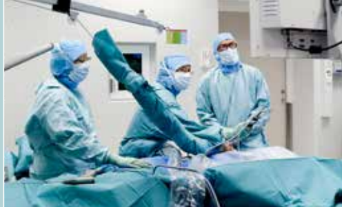
Størst i landet på en rekke kirurgiske prosedyrer.