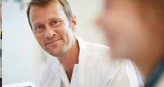
Vi vil gi god og omsorgsfull behandling.

Lovisenberg distriktpsikiatriske senter (LDPS) gir et bredt og tverrfaglig behandlingstilbud innen psykisk helsevern og rusbehandling til den voksne befolkningen i Lovisenberg sektor. LDPS tilbyr poliklinisk behandling, gruppebehandling, akutteam og ambulant virksomhet, med blant annet Fleksibelt Aktivt oppsøkende team (FACT) i samarbeid med bydelene. En åpen døgnpost gir planlagt døgnbehandling. LDPS har også en poliklinikk i samarbeid med prosjektet "Raskere tilbake".