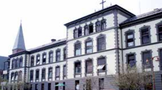
Fasade mot Lovisenbergparken, byggeår 1890.