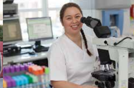
Sterk satsning på pasientnær forskning.